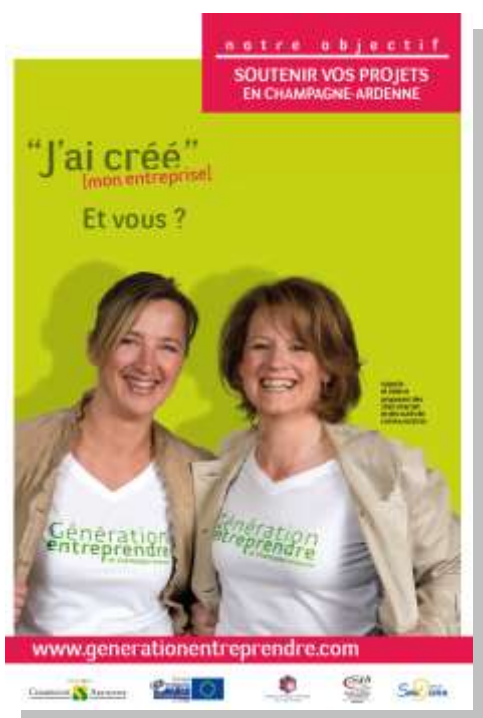
Visuel de la 1 ère vague d'affichage 2009 de la campagne régionale de promotion et d'accompagnement à la création et reprise d'entreprise