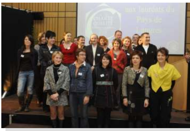
Les lauréats du Pays de Langres

La prospection de la démarche Charte Qualité sur la Haute-Marne avait débuté dès le mois de janvier et les 1ères formations avaient eu lieu en février.