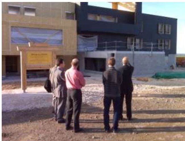
Visite de la zone Plein Est à Chaumont

19 entreprises au total ont participé à cette opération. Celle-ci sera renouvelée en 2010.