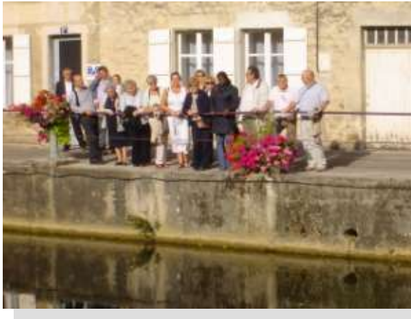
Les participants de l'Eductour 2009 ont pu découvrir les charmes touristiques de la ville de Joinville.