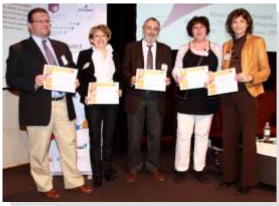
Remise des certificats Qualité Entreprendre En France