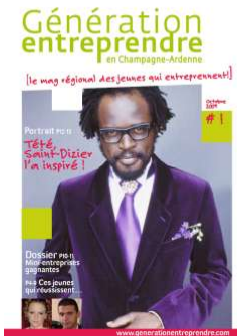
Couverture du premier numéro du magazine « Génération Entreprendre en Champagne-Ardenne », destiné aux « jeunes ».