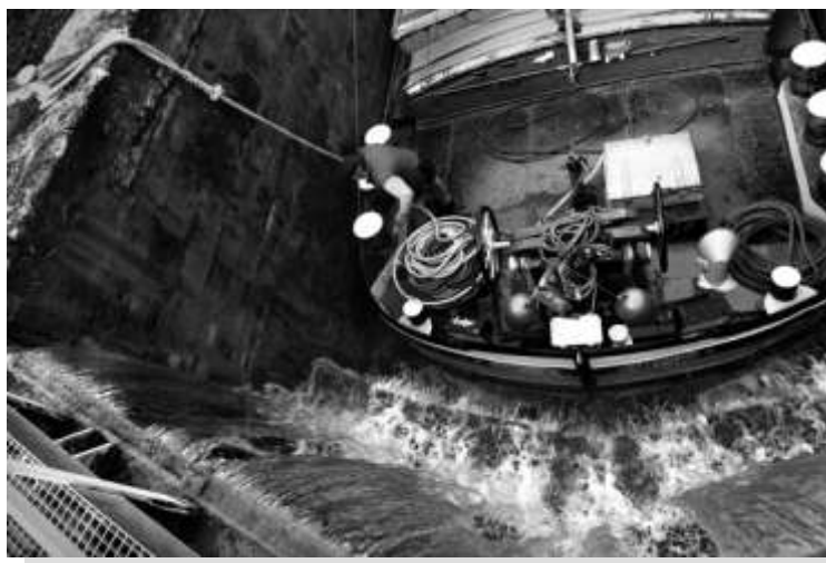
Prix spécial du Jury récompensant la meilleure photographie Daniel Mole : l'Ecluse