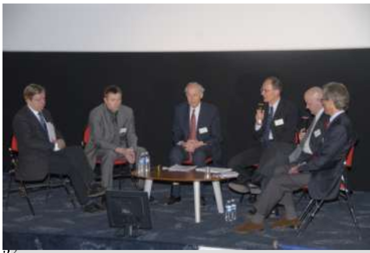
Une édition spéciale de Business Affaires au cours de laquelle a été présenté le dispositif Haute-Marne Fonds Propre.

Comme l'année précédente, 4 éditions de Business Affaires ont eu lieu en 2009 : 2 à Chaumont et 2 à Saint-Dizier. Chaque soirée a réuni entre 80 et 100 personnes.