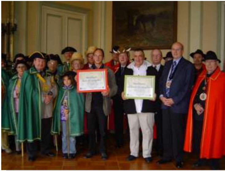
Remise des prix du concours de la meilleure rilette et de la meilleure hure de sanglier

Enfin, un second jury aux délicates papilles a départagé les finalistes du concours de la meilleure rilette et de la meilleure hure de sanglier à l'hôtel de ville de Chaumont en présence des confréries haut-marnaises. Elles ont apporté une touche très colorée à la rencontre du public sur le marché de Chaumont, accompagnées par Luc Chatel.