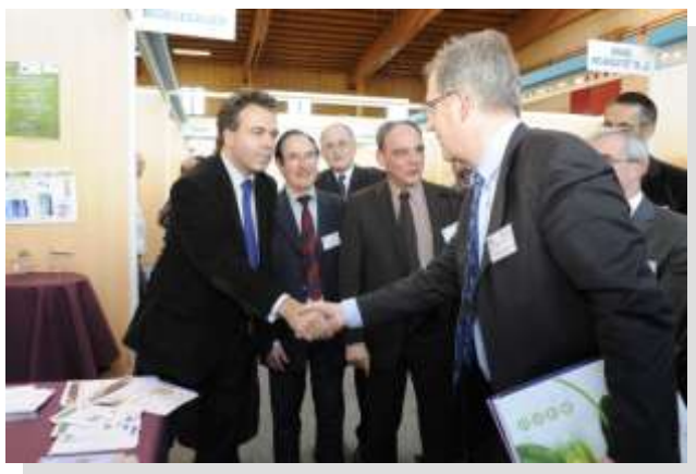
Luc Chatel a clôturé la 3 ème édition du Salon des Savoir-faire à Nogent