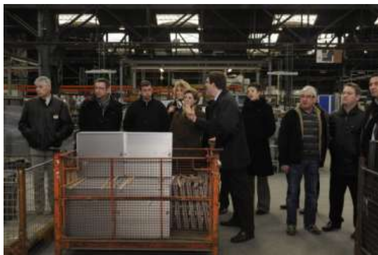
Les industriels haut-marnais en visite chez Manathan International