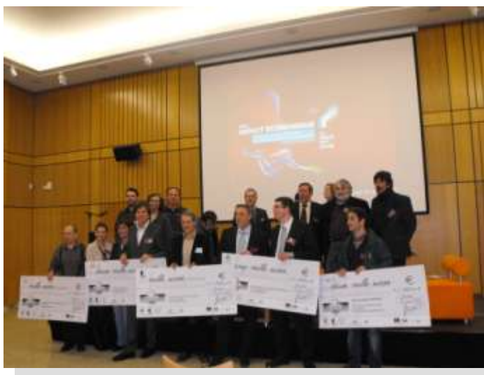
Les lauréats du concours « Création et reprise d'entreprise », lancée au cours du dernier trimestre de l'année 2008.

Au cours de cette soirée a eu lieu également la remise des prix du concours de la création et reprise d'entreprise lancé fin 2008, avec à la clé 11 000 € de prix, répartis entre les 5 lauréats sélectionnés parmi 60 dossiers reçus, tous secteurs d'activité confondus.